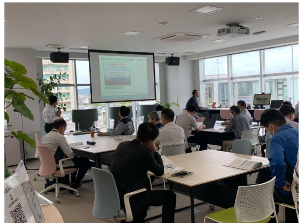
高田講師講義風景