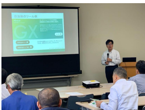
高田講師講義風景